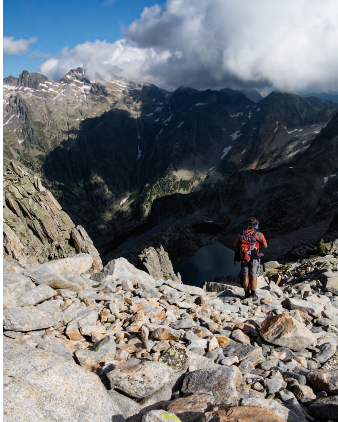
Dal Colletto di Bresses uno sguardo verso il Lago superiore di Fremamorta e la Serra dell'Argentera.

06 Anello del Lago del Pizzo , Valle Tanaro, ORMEA.