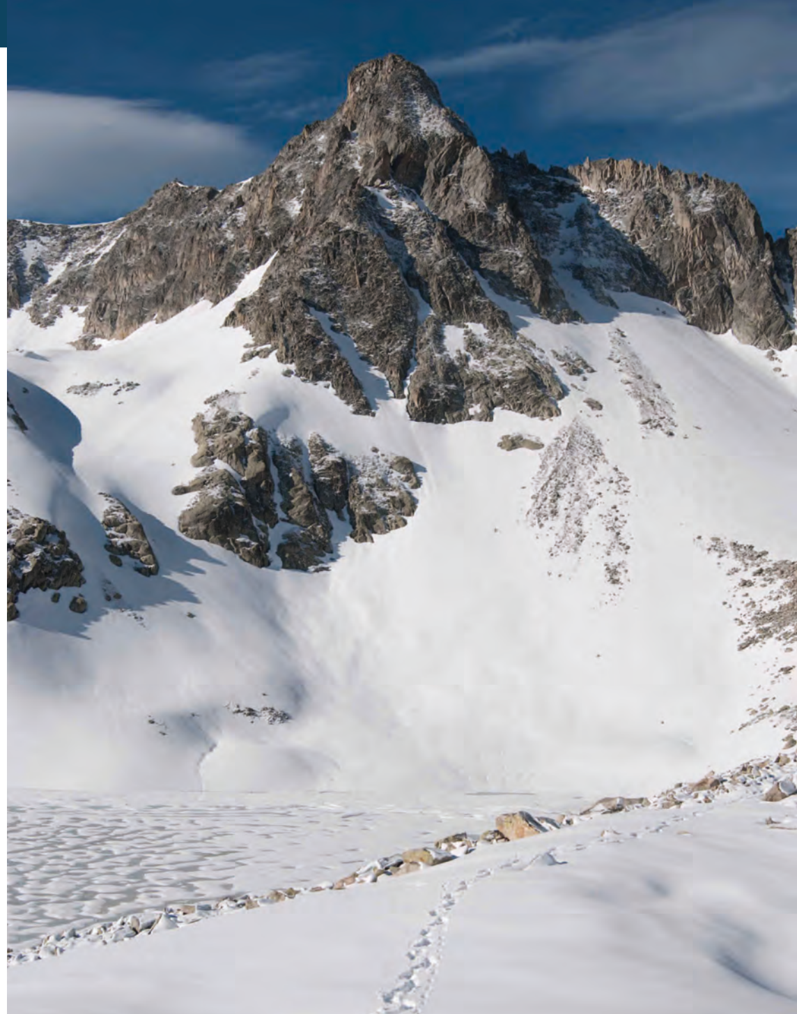
Testa delle Portette: solo una traccia rompe la perfezione della montagna innevata.

01 Gita scialpinistica, meta da stabilire, SAVIGLIANO.