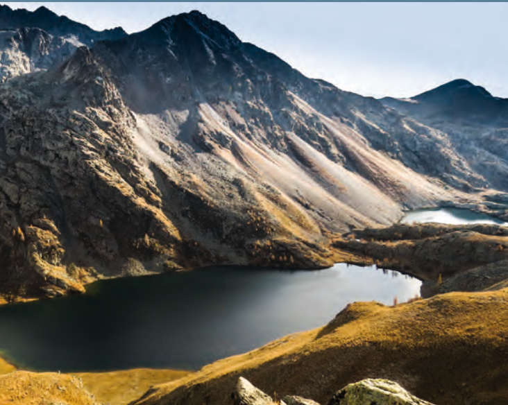
Laghi di Vens, una delle più belle mete delle Marittime.

11 Gran Tour dei 7 Comuni del Fossanese , FOSSANO , Gruppo Cicloescursionismo.