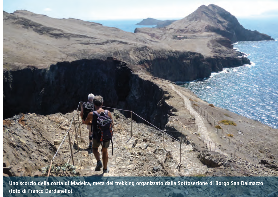
Uno scorcio della costa di Madeira, meta del trekking organizzato dalla Sottosezione di Borgo San Dalmazzo.

d'Evigno, Valle Merula, SAVONA, R. Panetta.