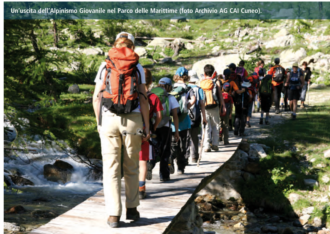
Un'uscita dell'Alpinismo Giovanile nel Parco delle Marittime.