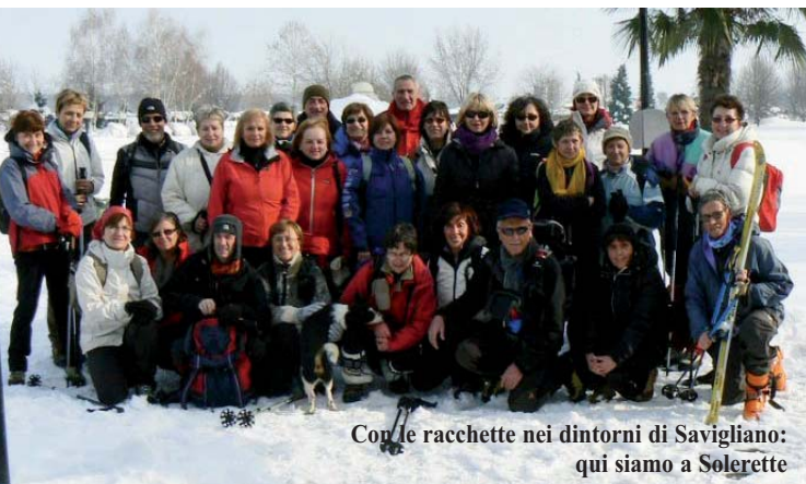
Con le racchette nei dintorni di Savigliano: qui siamo a Solerette

- 10 marzo: Amici per le pelli - meta da stabilire tradizionale ritrovo annuale per scialpinisti e racchettari con pranzo in amicizia