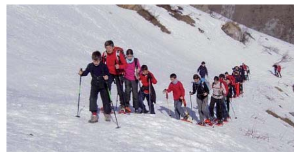
Nel programma due uscite con racchette da neve

- 15 settembre: Giro di Rocca La Meia - Valle Maira con le famiglie