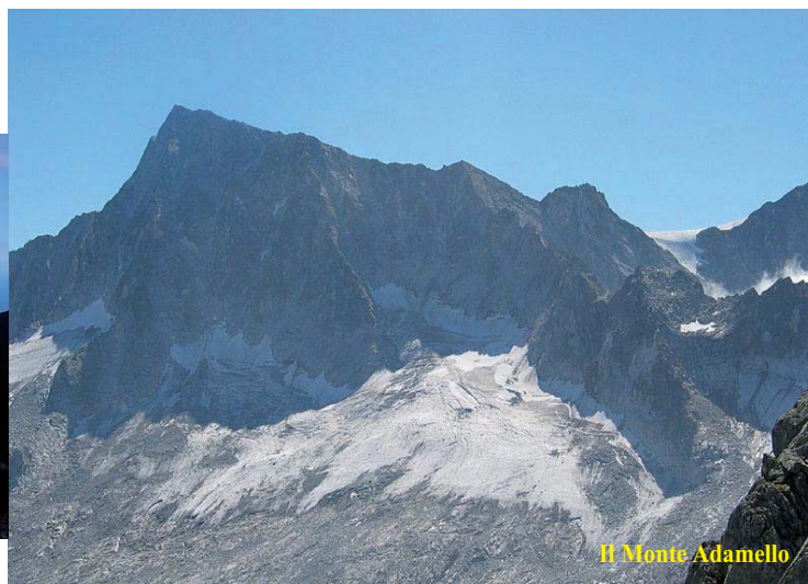
Il Monte Adamello

- 20-21 luglio: Monte Adamello Val Camonica - Alpi Retiche - Dal rifugio Garibaldi