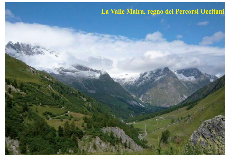
La Valle Maira, regno dei Percorsi Occitani

- 6 ottobre: Percorsi Occitani - Stroppo - Valle Maira - 20 ottobre: Camminata nelle Langhe con possibilità di pranzo