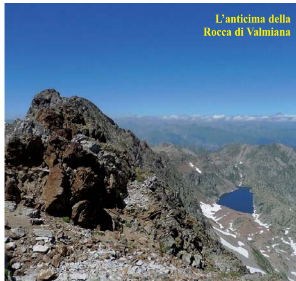
L'anticima della Rocca di Valmiana

- da sabato 8 a sabato 15 giugno: Trekking nella Sardegna nord-occidentale - settimana nella natura dell'isola mediterranea