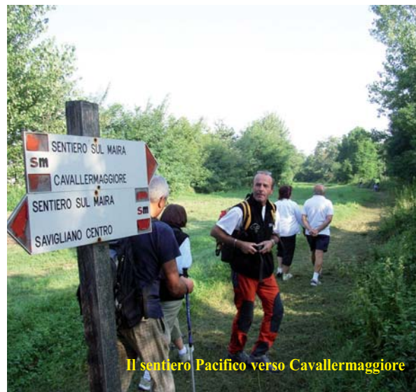
Il sentiero Pacifico verso Cavallermaggiore

- 25 aprile: Giornata sul sentiero "Pacifico" - lungo il Maira in direzione di Cavallermaggiore