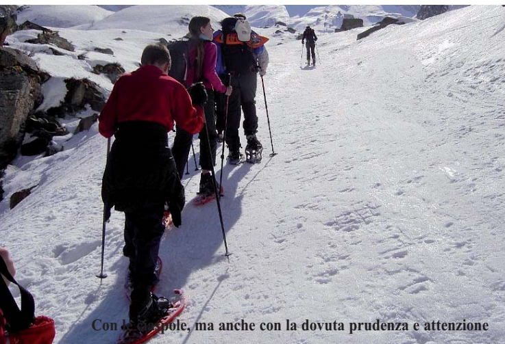
Con le spole, ma anche con la dovuta prudenza e attenzione

- 6 gennaio: Escursione con racchette da neve - meta da stabilire