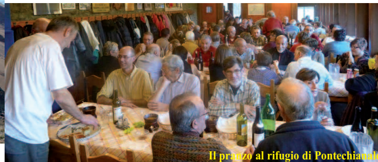
Il pranzo al rifugio di Pontechianale

- 18 novembre: Pranzo sociale al rifugio Savigliano - Pontechianale (Valle Varaita)