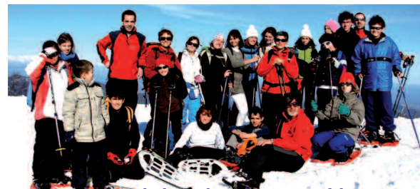
Anche le racchette fanno parte del programma