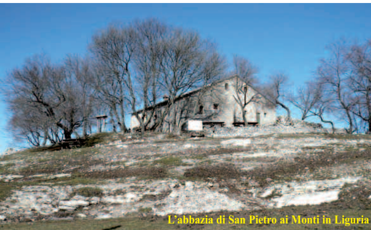
L'abbazia di San Pietro ai Monti in Liguria

- 18 marzo: S.Pietro ai Monti sopra Toirano - Liguria primo appuntamento con il tepore dell'ambiente marino e i profumi delle prime fioriture