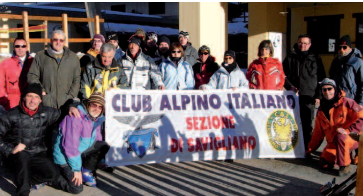
Pontechianale, una stazione sciistica ancora a misura di montagna

- 29 gennaio: Con gli sci sulle piste di Pontechianale - una giornata da "pistaioli" sulle nevi del centro della Valle Varaita